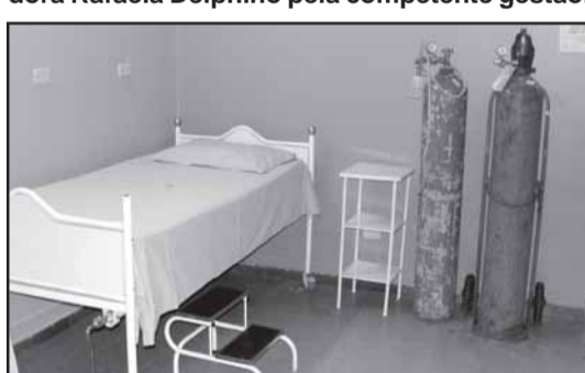
Acima: A nova sala de observação construída pelo Hospital. Abaixo: O momento de descerramento da placa que marcou a fusão