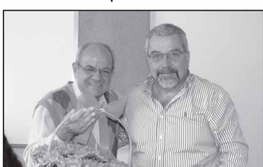
Acima: O Prefeito ao ser homenageado pelos funcionários do Hospital com flores. Abaixo: Autoridades visitando o Pronto Socorro.