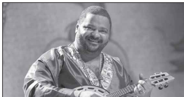
O sambista Arlindo Cruz hoje é uma das maiores estrelas da música brasileira e vai se apresentar em Além Paraíba assim como os famosos pagodeiros do Grupo Bom Gosto.