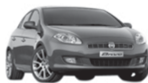
Conheça o novo FIAT Bravo

Veículos Novos - Semi-Novos - Peças e Acessórios - Assistência Técnica