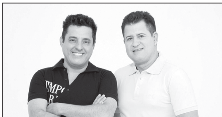
Bruno e Marrone, a dupla sertaneja mais famosa do Brasil atualmente vai se apresentar na FEXPO 2011 assim como o Grupo Capital Inicial (foto abaixo). Os shows ficarão lotados.