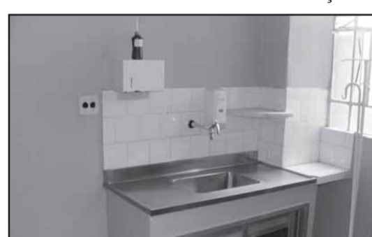
Acima: A nova sala de procedimentos para os profissionais do Pronto Atendimento. Abaixo: A placa que consignou a fusão HSS - Pronto Atendimento.