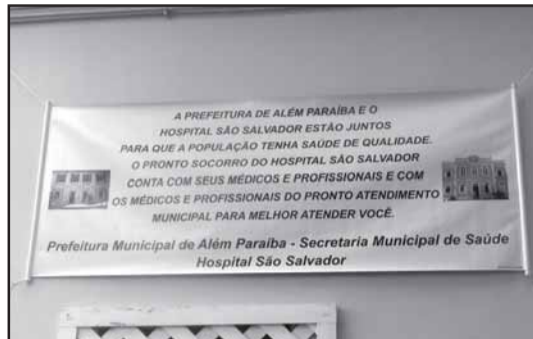
Uma faixa selando a parceria entre a PMAP e O HSS foi colocada na fachada do Hospital para marcar o momento histórico.