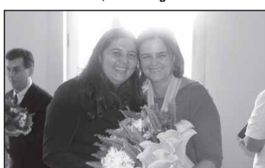
Os funcionários do Hospital fizeram questão de homenagear a Secretária de Administração com flores das mãos da Administradora do HSS.